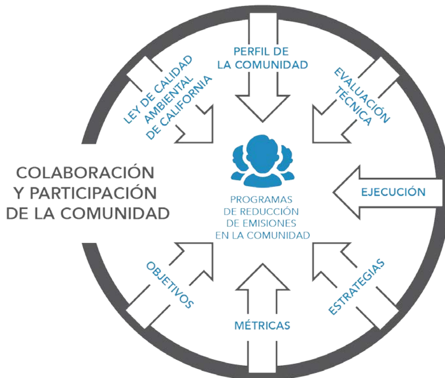
Figura 6 Elementos que Requiere un Programa de Reducción de Emisiones en la Comunidad

En la Figura 6 se proporciona una visión general de los elementos que exige un programa para la reducción de emisiones en la comunidad.