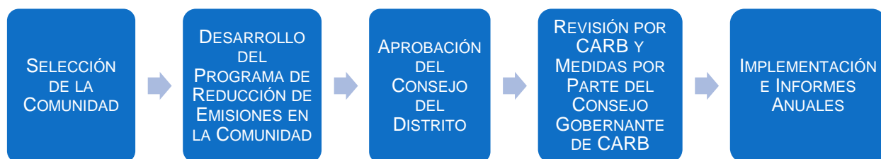
Figura 5 Resumen del Proceso de los Programas para la Reducción de Emisiones en la Comunidad

Los elementos generales para la inclusión en los programas para la reducción de emisiones en la comunidad están resumidos en la lista de verificación que se proporciona en la Tabla 1, con una lista de verificación detallada que se proporciona en la Tabla C-1. CARB revisará cada programa para la reducción de emisiones en la comunidad de los distritos de aire para asegurar que cumplen con los requisitos y que reducirán la exposición a la contaminación del aire en la comunidad designada. La lista de verificación detallada constituirá la base del proceso de revisión de CARB y, luego de un período de comentarios, cada programa para la reducción de emisiones en la comunidad se presentará ante el Consejo Gobernante de CARB para su implementación. El Consejo Gobernante de CARB podrá realizar una de cuatro medidas a la hora de considerar un programa de reducción de emisiones: aprobarlo, aprobarlo de forma condicional, aprobarlo de forma parcial o rechazarlo (en conjunto, representadas como una acción del Consejo Gobernante de CARB). CARB tiene el compromiso de trabajar de cerca con los distritos de aire y los comités directivos de las comunidades en el desarrollo de los programas de reducción de emisiones en la comunidad a fin de acelerar el proceso de revisión.