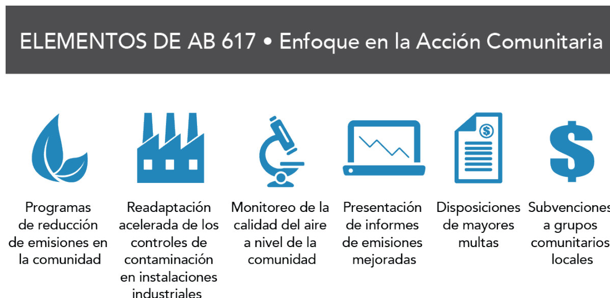
Figura 1 Elementos del AB 617 Centrados en la Comunidad

Lo más importante es que el apuntalamiento de AB 617 significa comprender que los miembros de la comunidad deben ser agentes activos para concebir, desarrollar e